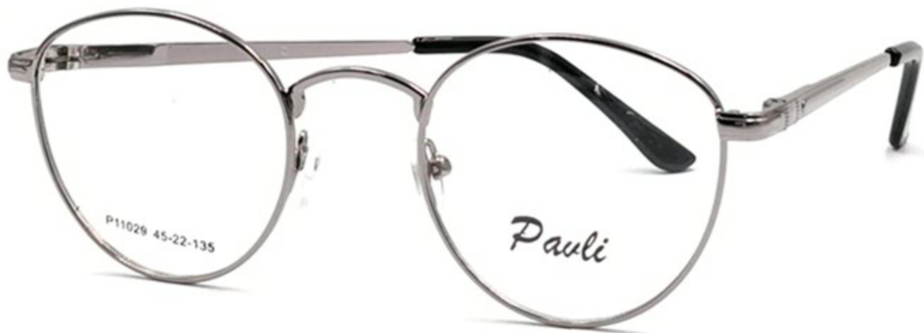
PAVLI P11029 C4 45-22-135