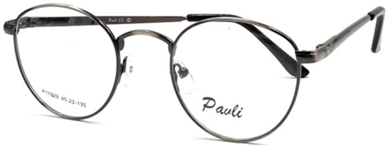
PAVLI P11029 C1 45-22-135