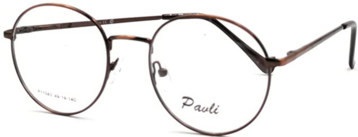
PAVLI P11043 C5 49-19-140