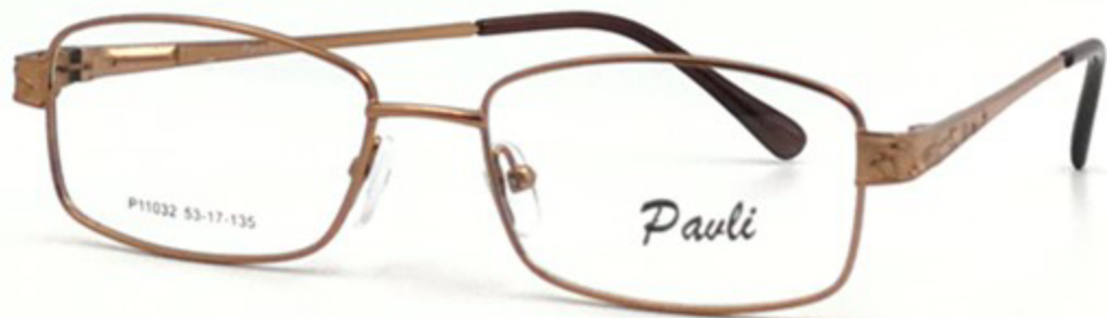
Pauli P11032 C2 53-17-135