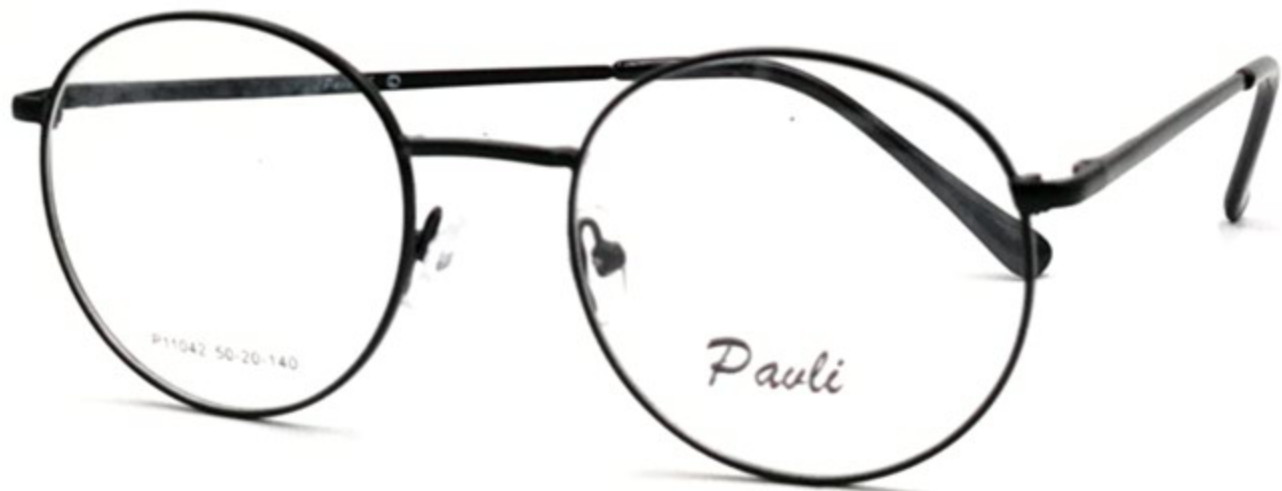
PAVLI P11042 C4 50-20-140