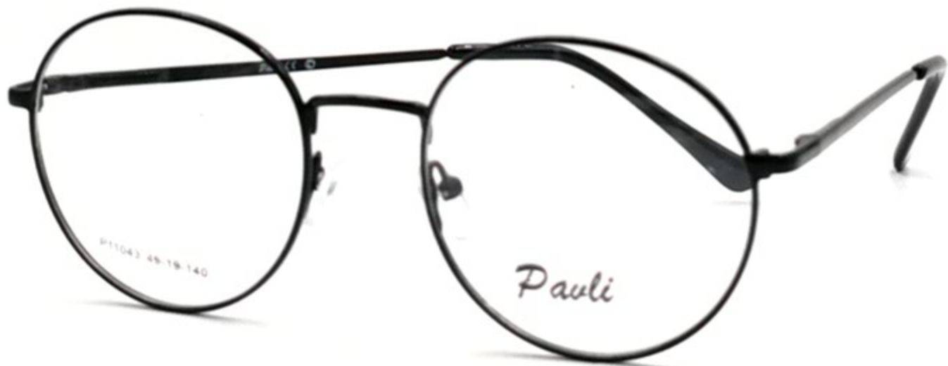
PAVLI P11043 C4 49-19-140