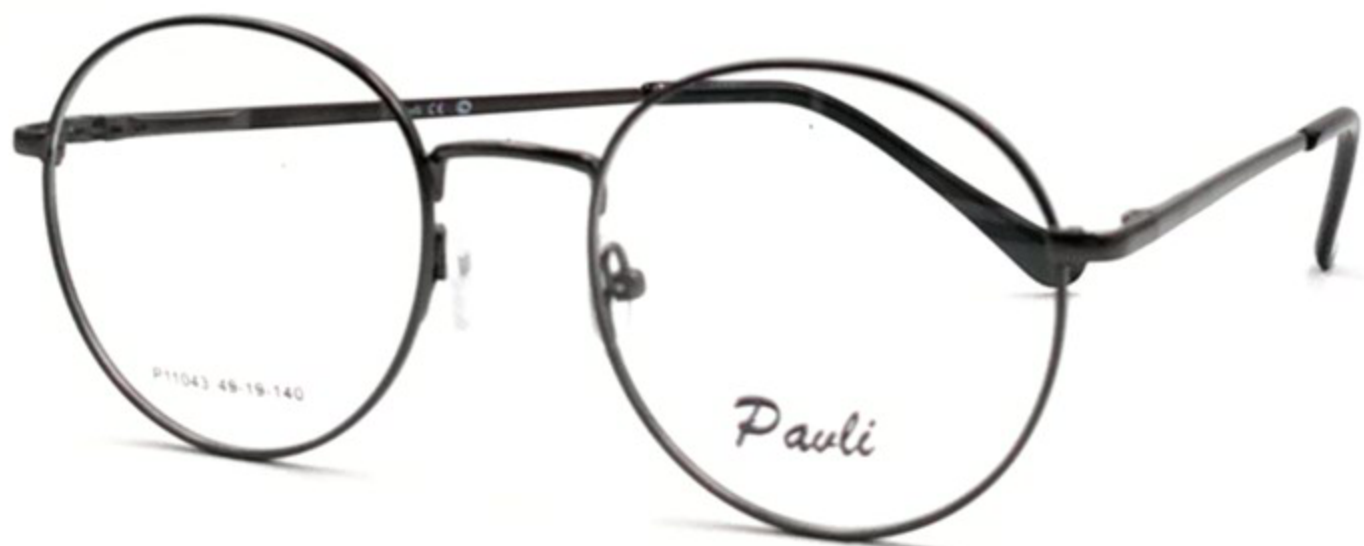
PAVLI P11043 C2 49-19-140