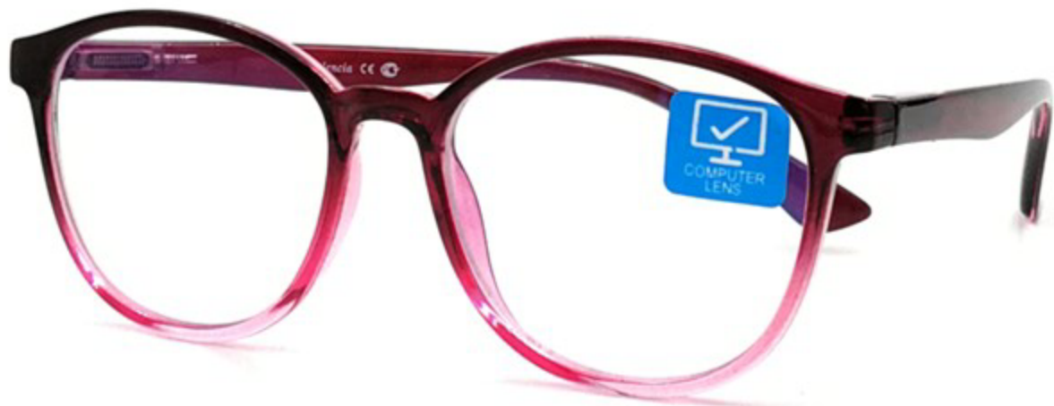
VALENCIA Компьютерные Очки HZ9689 C7