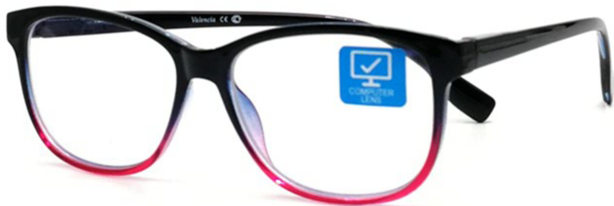
VALENCIA Компьютерные Очки HZ1899209 C16