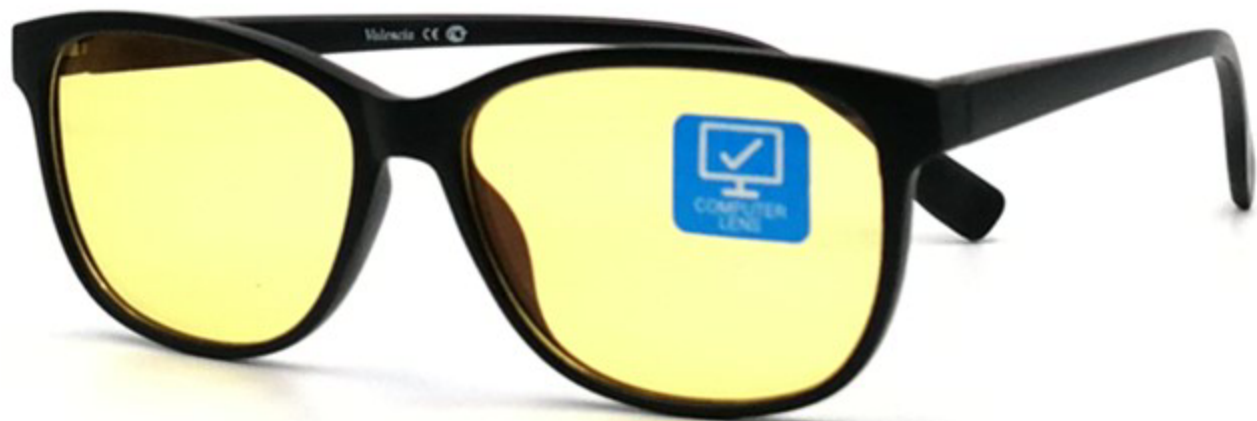
VALENCIA Компьютерные Очки HZ1899209 C14