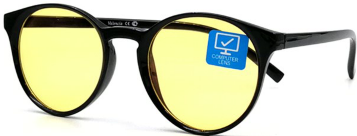
VALENCIA Компьютерные Очки HZ9629 C1-1