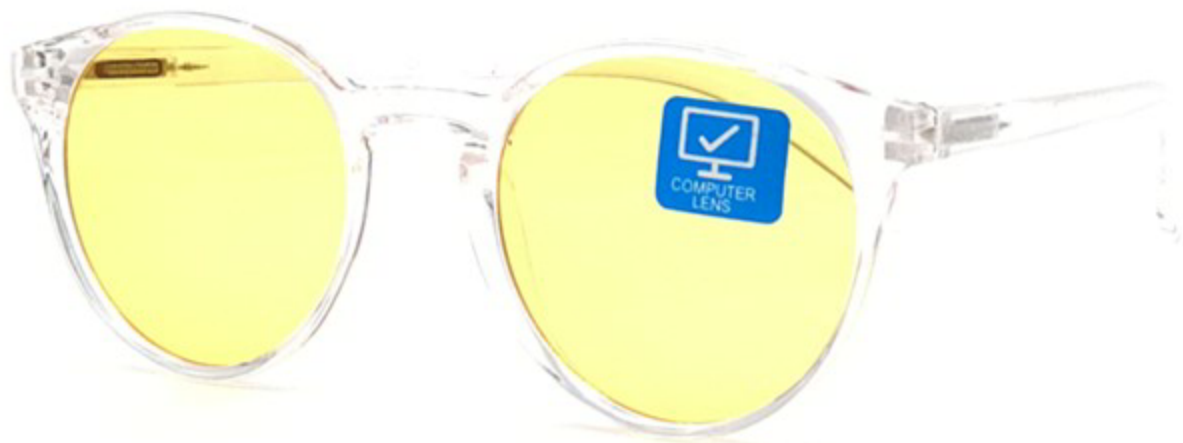
VALENCIA Компьютерные Очки HZ9629 C4-1