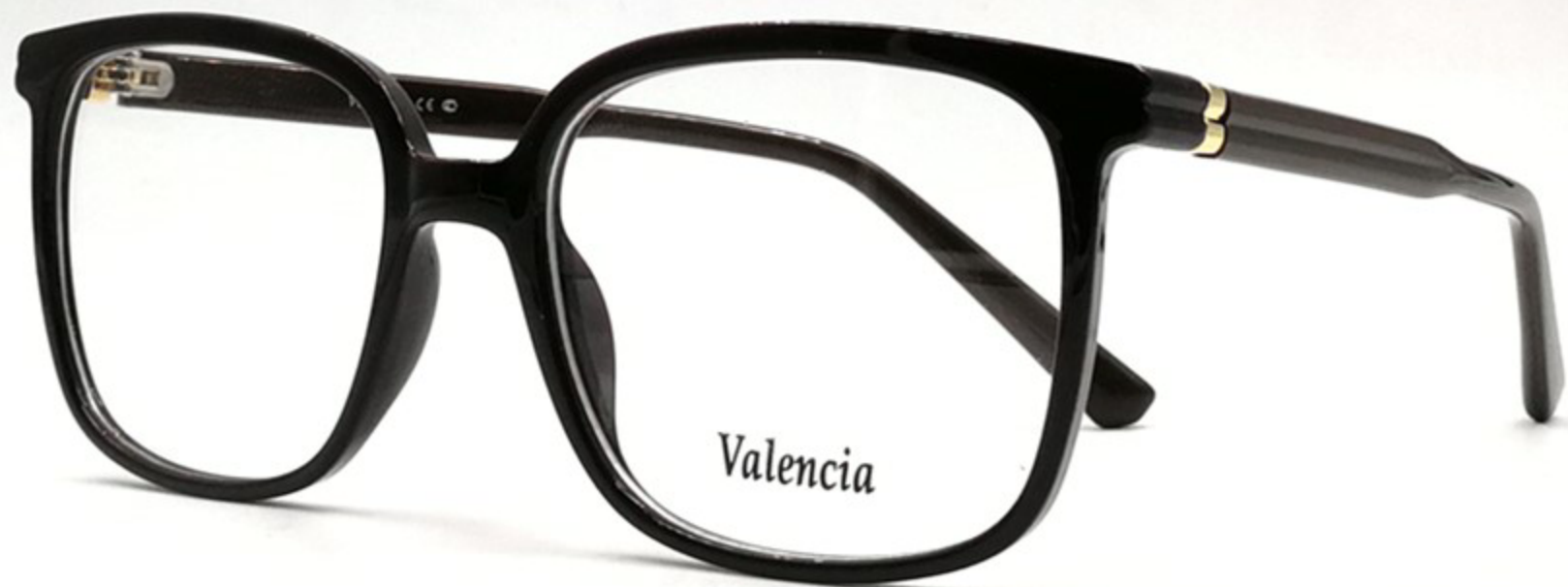
Valencia V42318 C1 53-19-145