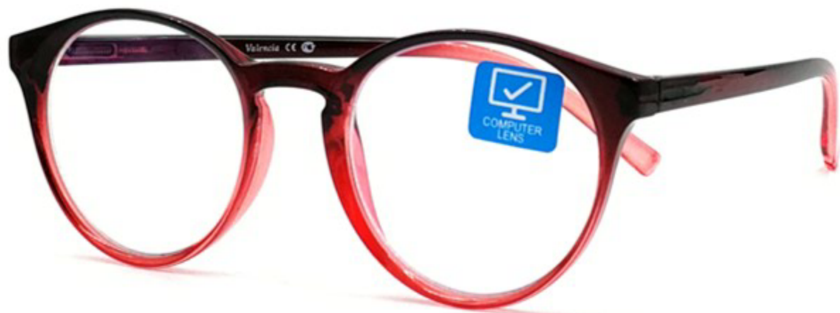
VALENCIA Компьютерные Очки HZ9629 C7