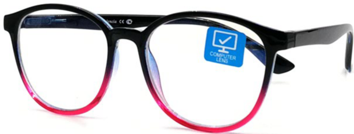
VALENCIA Компьютерные Очки HZ9689 C11