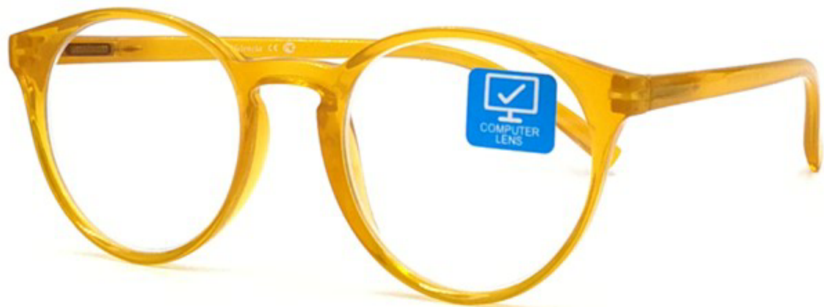
VALENCIA Компьютерные Очки HZ9629 C5