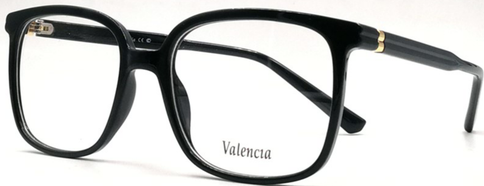
Valencia V42318 C3 53-19-145