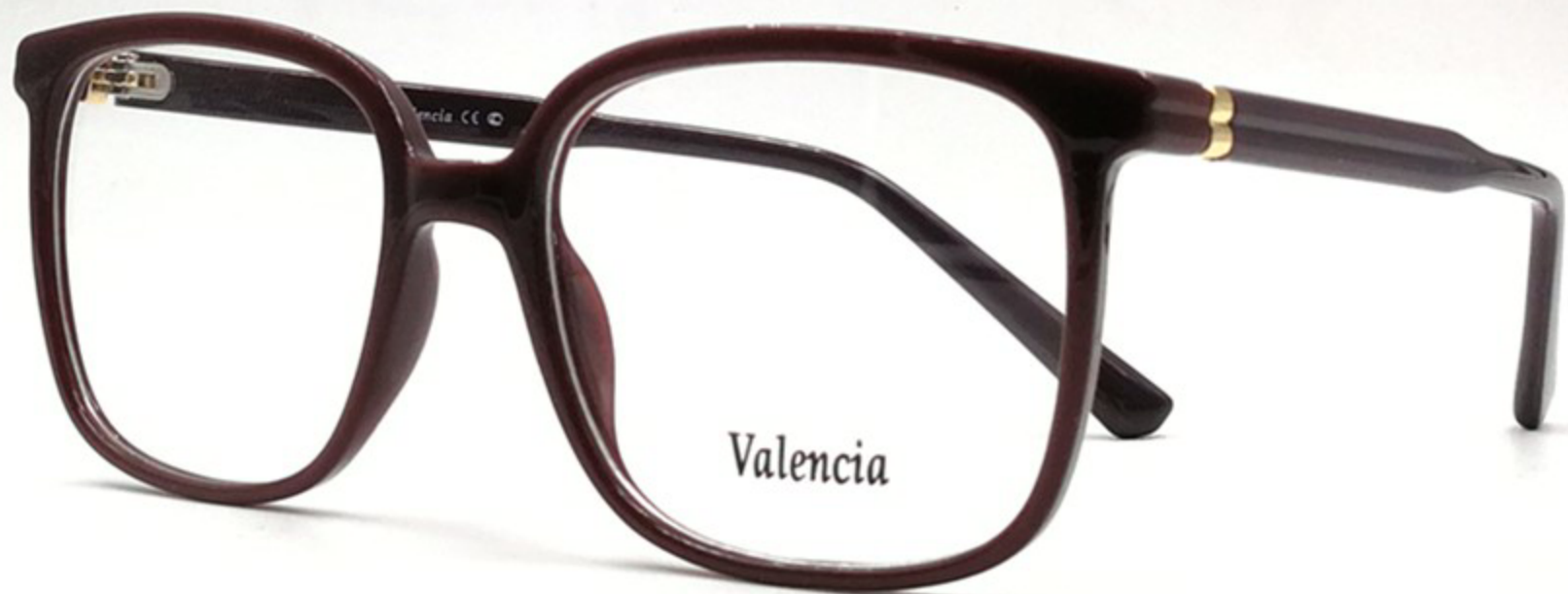
Valencia V42318 C5 53-19-145