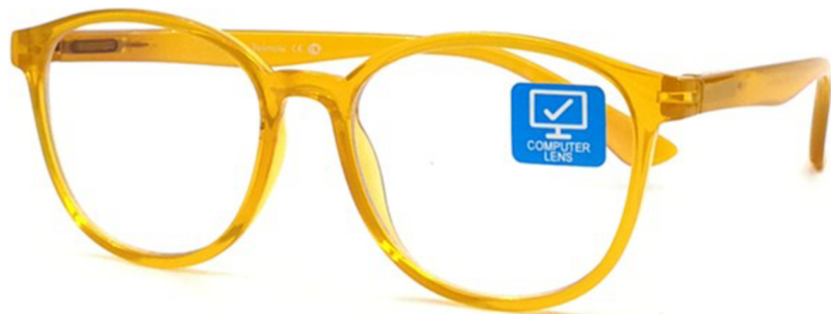
VALENCIA Компьютерные Очки HZ9689 C5