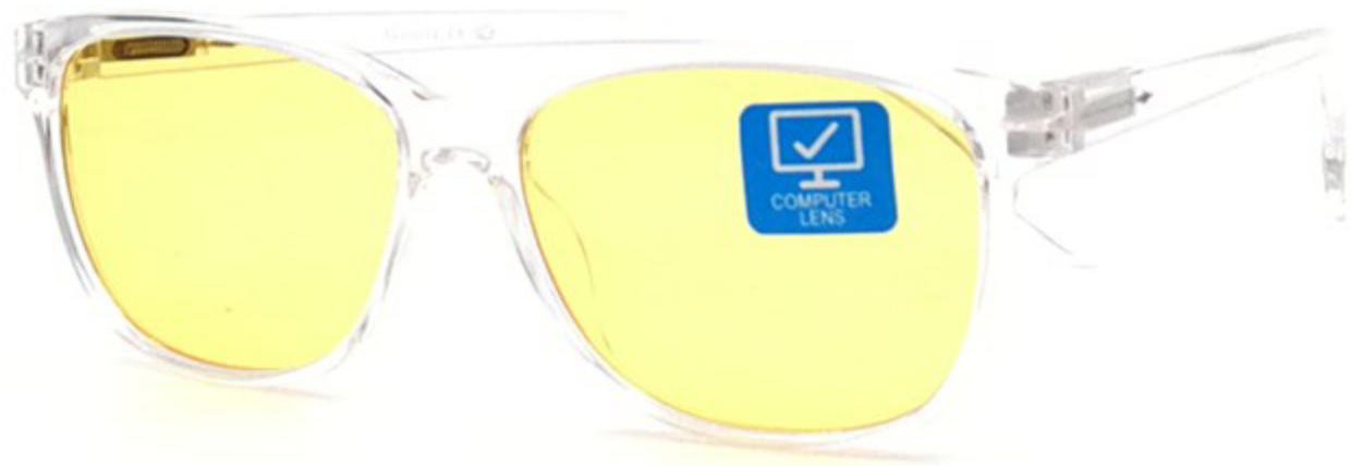
VALENCIA Компьютерные Очки HZ1899209 C8